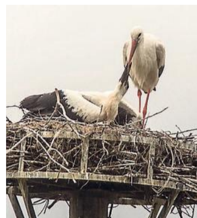
Terug in Baarn. CASPAR HUURDEMAN

Eembrugge * Het lijkt gelukt. Na precies 68 jaar heeft Eembrugge weer ooievaars voortgebracht. Op de paal die al al jaren in de tuin